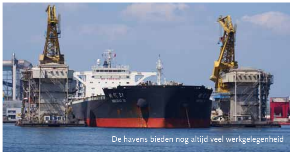
De havens bieden nog altijd veel werkgelegenheid

Of we het nu hebben over Mohammed, Wesley of Georgio die geen stageplek kunnen vinden of Achmed, Piet en Sylvia die na een reorganisatie op straat zijn komen te staan, hoe zorgen we ervoor dat jongeren hun opleiding kunnen afronden en daarna klaargestoomd zijn voor de arbeidsmarkt? Hoe zorgen we ervoor dat ouderen kunnen aantonen dat zij in hun werkzame leven al veel hebben geleerd zonder dat zij daar het benodigde diploma voor hebben? Vroeger had Tata een eigen opleidingscentrum.