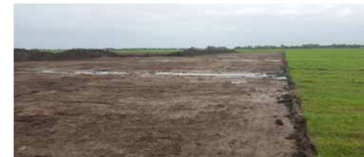
Afgeplagd weiland bij Catrijp waar de voedselrijke toplaag is verwijderd

Tjeerd Talsma - gedeputeerde Natuur en Milieu