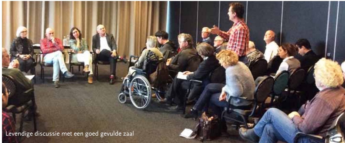
Levendige discussie met een goed gevulde zaal

DOOR RINA VAN ROOIJ, STATENLID NOORD-HOLLAND