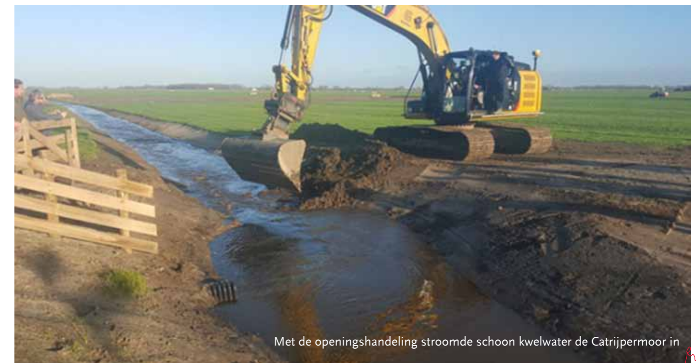
Met de openingshandeling stroomde schoon kwelwater de Catrijpermoor in