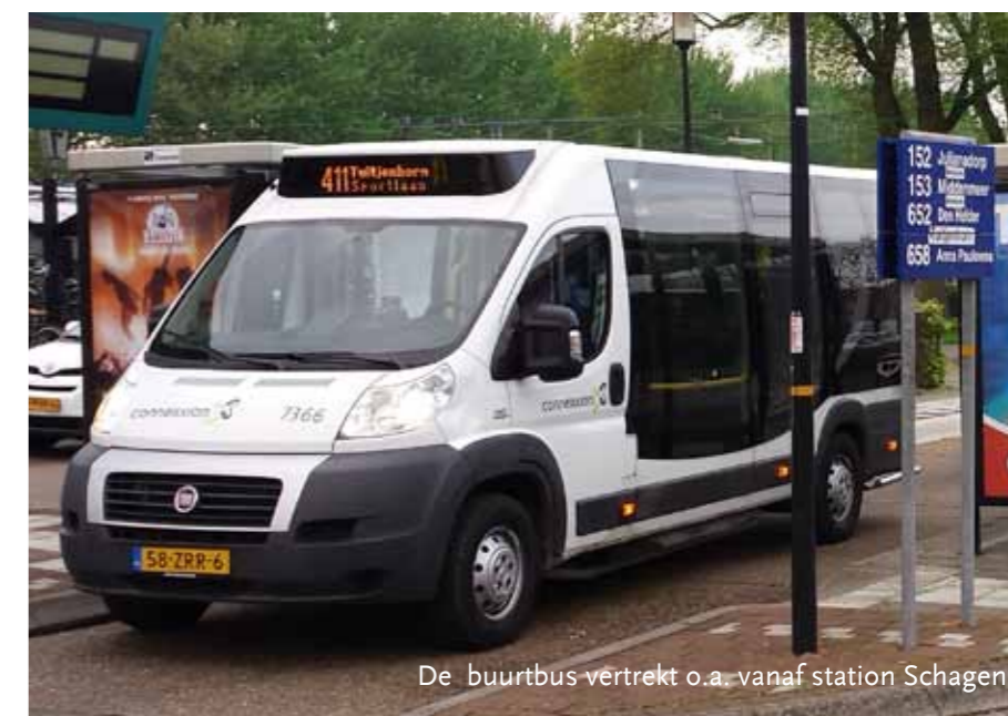
De buurtbus vertrekt o.a. vanaf station Schagen