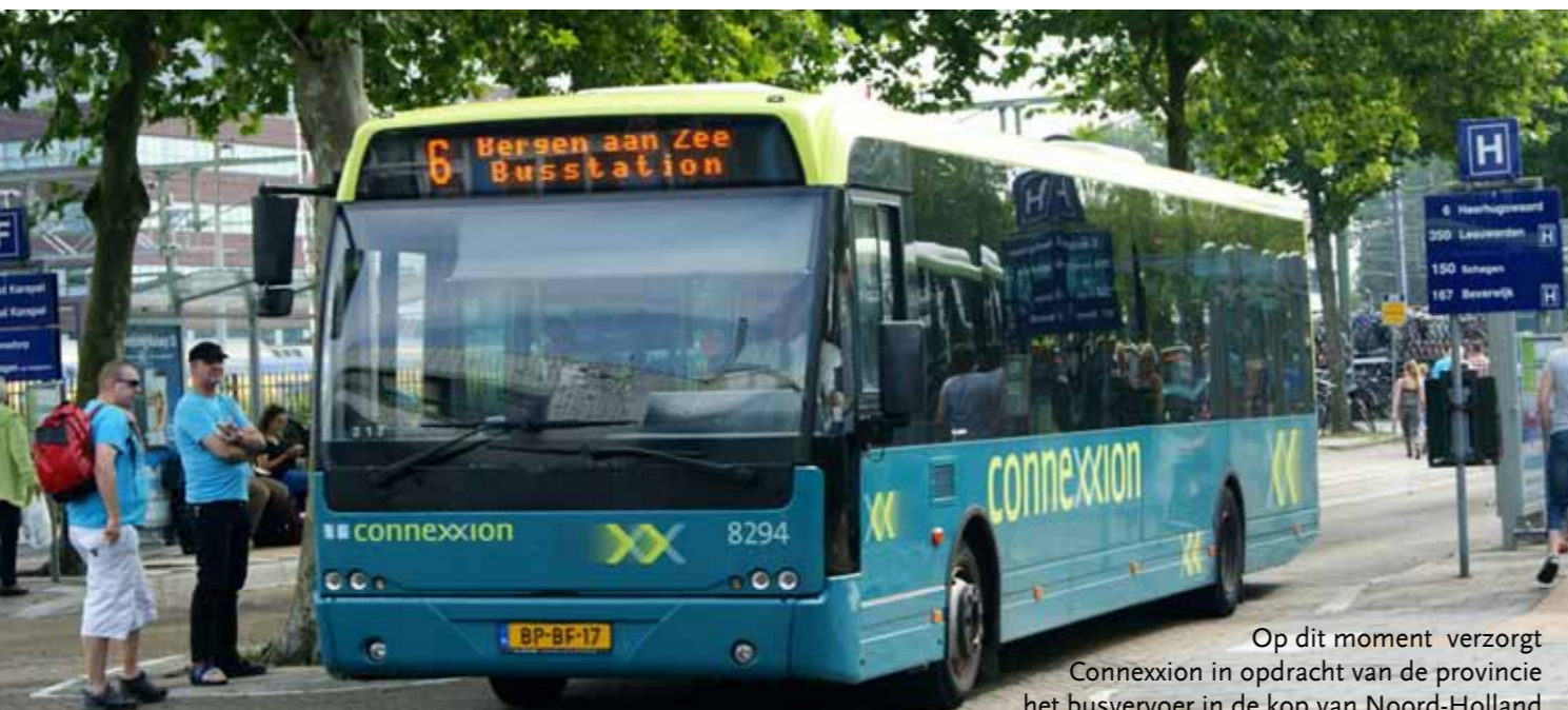
Op dit moment verzorgt Connexion in opdracht van de provincie het busvervoer in de kop van Noord-Holland