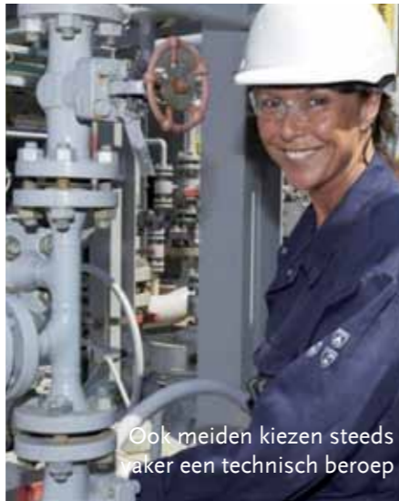
Ook meiden kiezen steeds vaker een technisch beroep

lang, maar missen bijvoorbeeld bepaalde kwalificaties. Ze krijgen onder meer een cursus Engels, sollicitatietrainingen of ze leren wat personal branding is en hoe ze dat moeten toepassen. In 2015 hebben bijna 100 deelnemers een baan gevonden op Schiphol. In 2016 waren dit er 57. En 130 zitten nog halverwege het traject. De provincie ondersteunt dit financieel, en daar ben ik trots op!