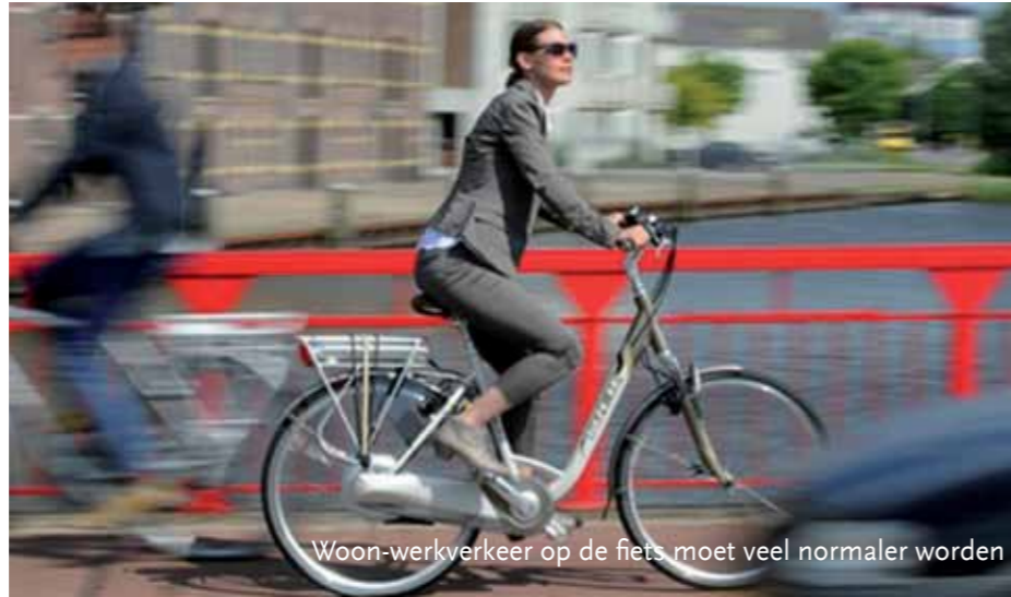
Woon-werkverkeer op de fiets moet veel normaler worden

Verschuiven vooruitstrevende provincies kwamen hun goede voorbeelden delen. Noord-Brabant vertelde bijvoorbeeld hoe je mensen verleidt om de fiets te pakken in plaats van de auto en Utrecht heeft behalve veel snelfietspaden