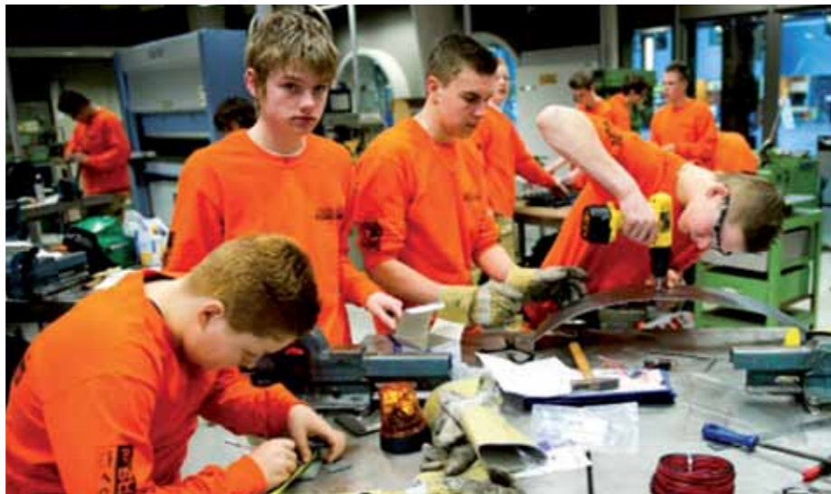
Met promotie-events worden jongeren al zo vroeg mogelijk geïnformeerd over beroepen in de techniek

Onze focus ligt op techniek en daar kun je niet vroeg genoeg bij zijn. De provincie sponsort de Promotie Events Techniek (PET) die gericht zijn op het basisonderwijs. Hiermee helpen we leerlingen in het basisonderwijs een beeld te krijgen van techniek en hun talenten te ontdekken. Laatst was ik op werkbezoek bij één van deze events. Ik werd rondgeleid en heb veel leerlingen gesproken over hun ideeën en wat ze wel of niet aanspreekt. Heel leerzaam maar vooral ook leuk! We organiseren in totaal 7 evenementen. Na Purmerend en Zaanstad is het de beurt aan Hoorn, Alkmaar, Den Helder, de regio's Gooi en Vecht en IJmond. Als gedeputeerde en voormalig onderwijsmanager word ik hier heel blij van!