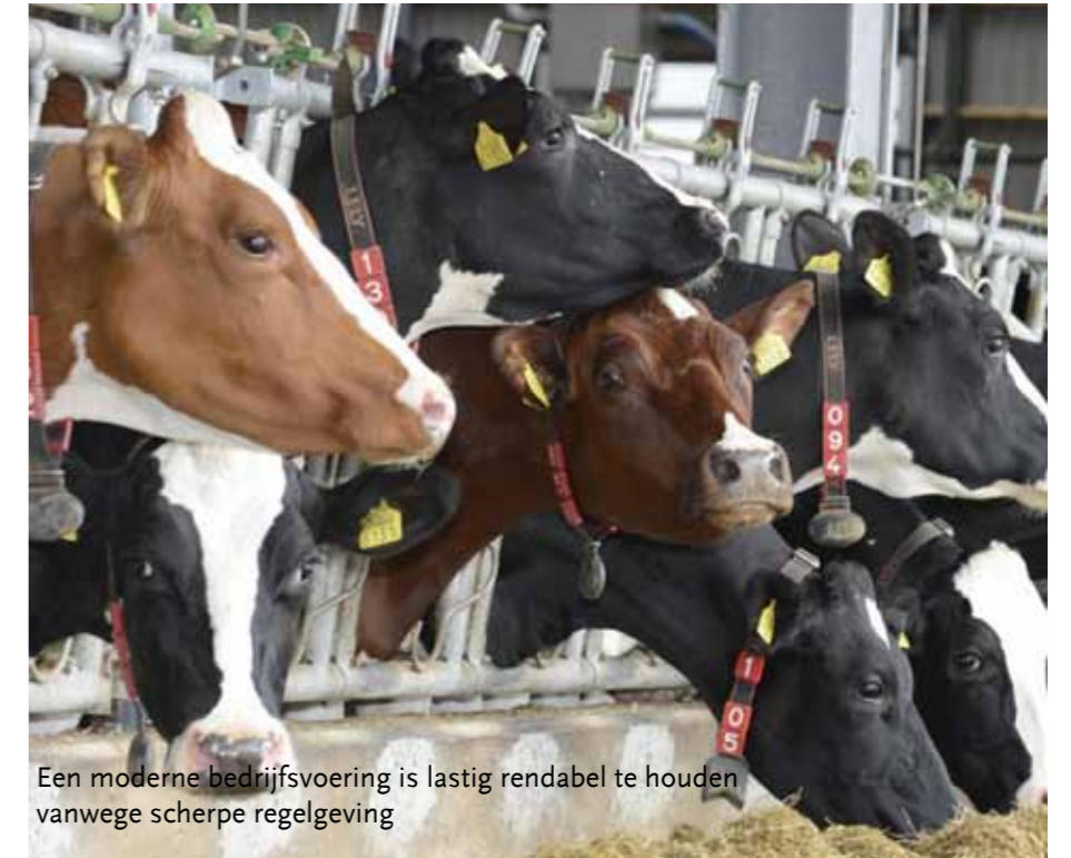
Een moderne bedrijfsvoering is lastig rendabel te houden vanwege scherpe regelgeving

In de laatste anderhalf jaar echter is de (Europese) regelgeving op het gebied van