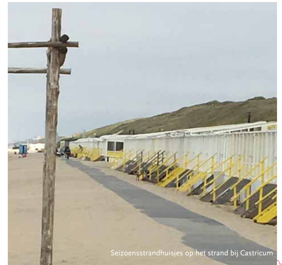
Seizoensstrandhuisjes op het strand bij Castricum

strandpaviljoens die dan ieder 6 evenementen per seizoen mogen organiseren. Dit komt neer op 24 evenementen die voor behoorlijke overlast zorgen. Dit idee van een 'bruisend strand' staat haaks op het voorstel van Natuurmonumenten, Landschap Noord-Holland en het PWN voor de kust. Zij zien het strand van Castricum als een 'familiestrand'. Gezien de ligging van Castricum, met de grote camping Bakkum vlak in de buurt kan de PvdA fractie zich hier goed in vinden en wil bezien of de huidige strandhuisjes wel in dit concept passen.