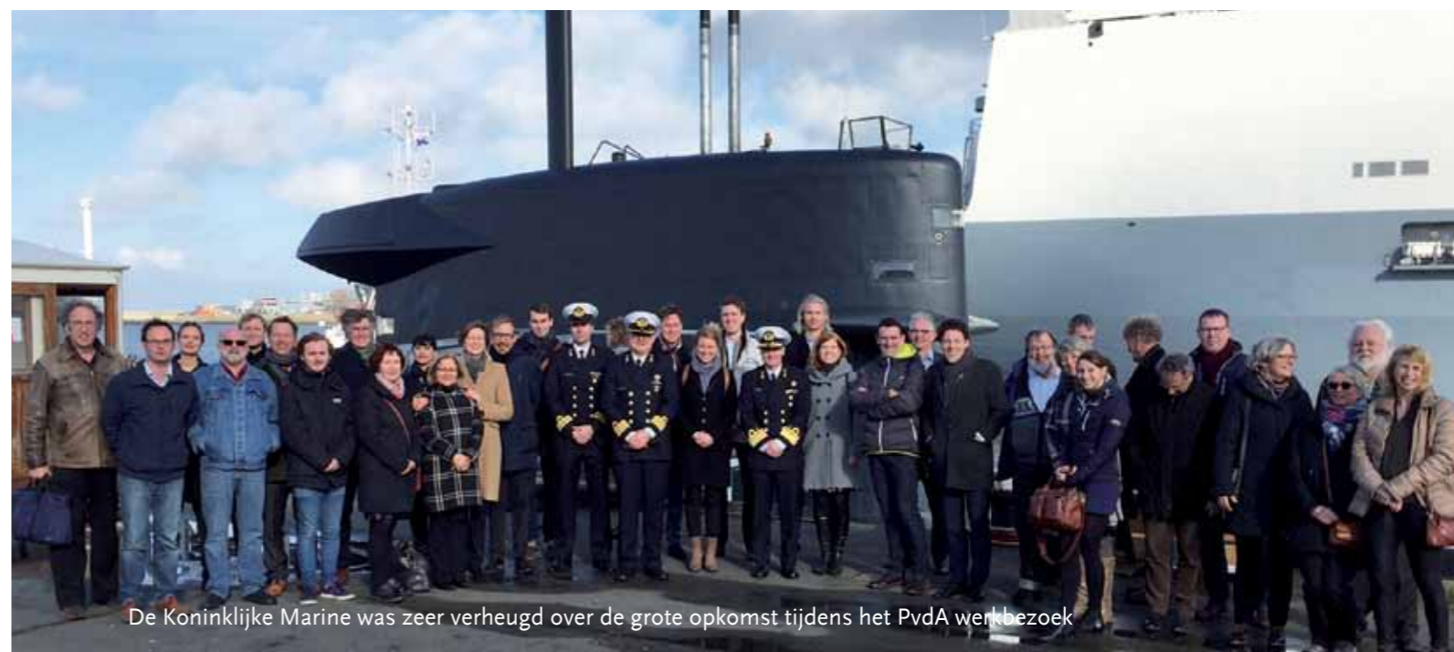
De Koninklijke Marine was zeer verheugd over de grote opkomst tijdens het PvdA werkbezoek