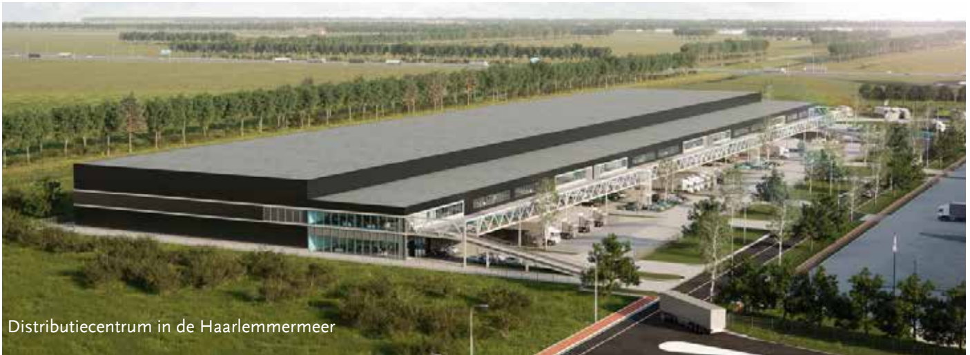
Distributiecentrum in de Haarlemmermeer