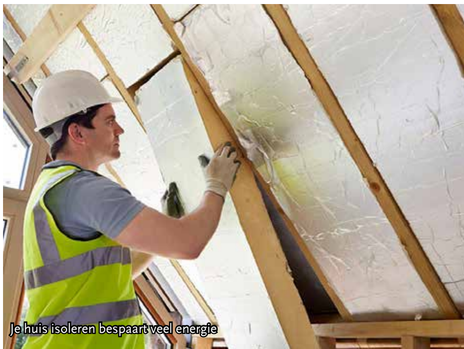
Je huis isoleren bespaart veel energie

Informatie over de warmtetransitie vindt u bij uw gemeente, uw raadslid en op de website van de provincie Noord-Holland. In meerdere gemeenten zijn ook energieloketten en energieambassadeurs actief.