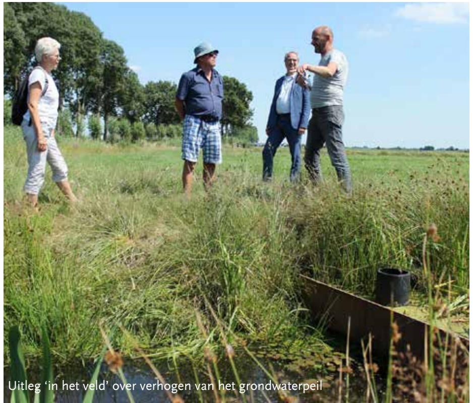
Uitleg 'in het veld' over verhogen van het grondwaterpeil

Het rapport van de Raad voor de leefomgeving en Infrastructuur (RLI) is duidelijk. Bodemdaling tegengaan in het veenweidegebied is het verhogen van de grondwaterstanden. Hogere grondwaterstanden leveren ook een belangrijke bijdrage aan het verminderen van de CO 2 uitstoot en het al duizend jaar bestaande adagium van "peil volgt functie" naar "functie volgt peil"